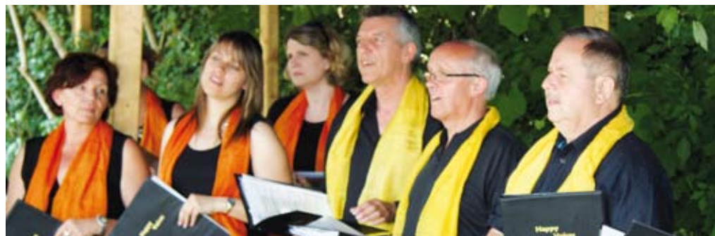
Die „Happy Voices“ begeistern mit ihren tollen Liedern

Ein buntes Programm mit Sinnesparcours, Gestaltungsangeboten im neuen Werkraum und einem Bewegungsangebot ermöglichte Einblicke in die Tagesstättenarbeit und sorgte für gute Stimmung und ungezwungene Begegnungen der vielen Besucher.