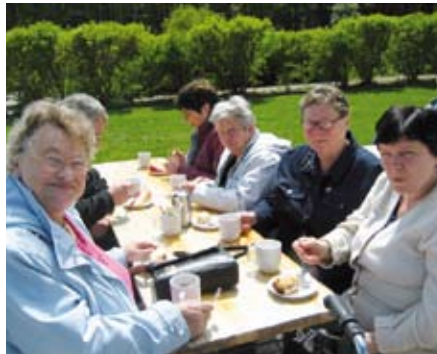
Kaffeepause bei strahlendem Sonnenschein

Nach dem Mittagessen entspannten einige im Freizeitbad Salinarium, während andere sich in einem gemütlichen Café im Kurpark niederließen