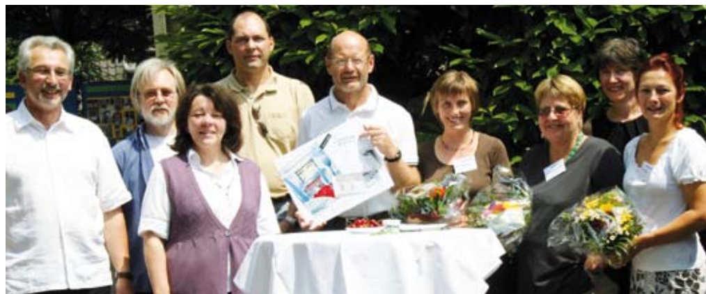
Große Freude bei der Scheckübergabe an die Tagesstätte

So nutzen die Tagesstättenbesucher zunehmend aktiver die zusätzlich angemieteten Räume in der Schulgasse 1 und dem eigens für die Projekte der Tagesstätte ausgestatteten Werkraum unter ergotherapeutischer Anleitung. Es konnte insbesondere Zugang zu