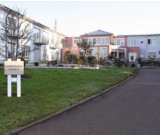
Der neue Sitz der Verwaltung unserer gGmbH

Die Diakonie im Landkreis Karlsruhe gemeinnützige GmbH, Betreiberin von Pflegeheimen, Betreutem Wohnen im Landkreis Karlsruhe sowie des Hospizes in Ettlingen ist nach Malsch umgezogen. Die neue Adresse lautet: