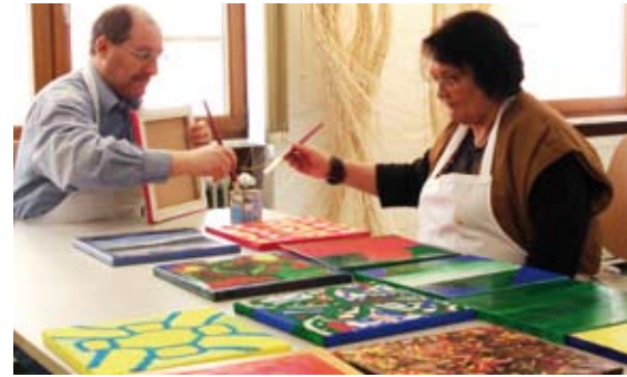
Es kann losgehen! Ein Blick in den neuen Werkraum in der Schulgasse.

Zum 1. Februar konnten Mitarbeiter des Diakonischen Werkes in Bretten ihre Arbeit an neuer Stelle aufnehmen. Aufgrund des gestiegenen Platzbedarfes in der Dienststelle Bretten war eine Erweiterung notwendig geworden. Die neuen Räumlichkeiten bieten Platz für jeweils zwei Mitarbeiter der Bereiche Sozialpsychiatrie und Schuldnerberatung. Die Räume befinden sich in unmittelbarer Nähe zum Hauptsitz des Diakonischen Werkes im Herzen von Bretten. Besonders erfreulich ist die Tatsache, dass auch ein Werkraum für den Fachbereich Sozialpsychiatrie eingerichtet werden konnte. So ist es nun möglich, das ergotherapeutische Angebot für psychisch kranke Menschen zu erweitern und weiter zu professionalisieren. Der Werkraum bietet hervorragende