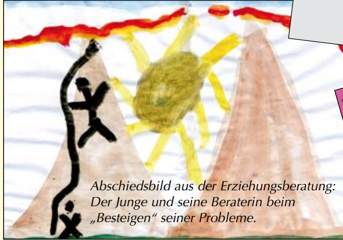
Abschiedsbild aus der Erziehungsberatung: Der Junge und seine Beraterin beim „Besteigen“ seiner Probleme.

Hallo, ja alles super gelaufen, wohne seit dem 08.11.09 in der Wohnung! Entschuldigen sie bitte, dass ich mich jetzt erst melde, war aber total im Stress! Vielen Dank für Ihre Hilfe, und dass ich immer kommen konnte, wenn ich was hatte!